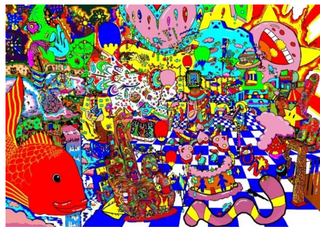
作品名「ポップンサガ」